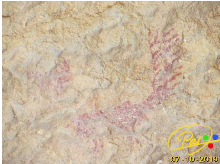
Pinturas del Abrigo de Quizans.