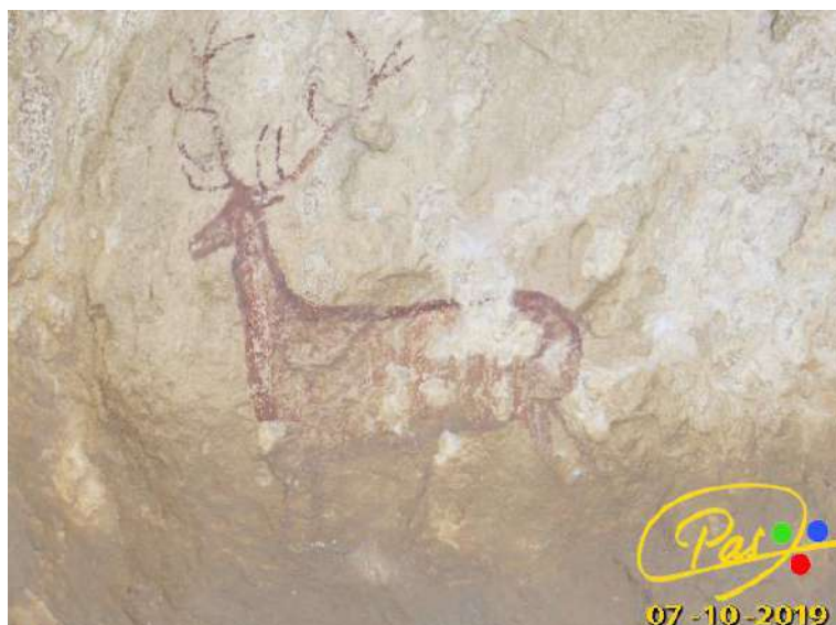
El Ciervo de Chimiachas.