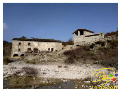
Molino de Almazorre

Un poste con varias señales nos indica la dirección hacia Almazorre y primero entre lo inefables muros de piedras y después en pronunciada bajada descendemos por una senda entre pinos y en algunos tramos con el barranco helado hacia el molino de Almazorre en donde