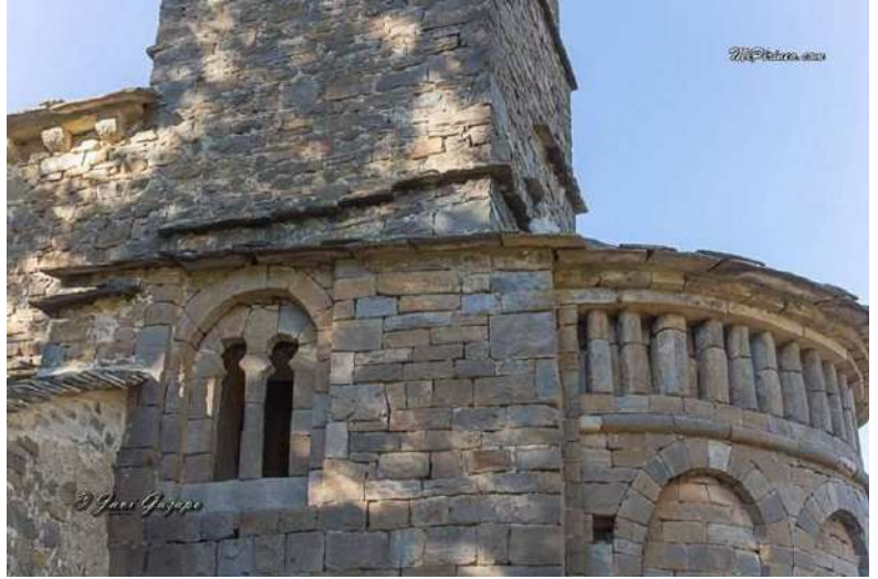
Iglesia de Susín