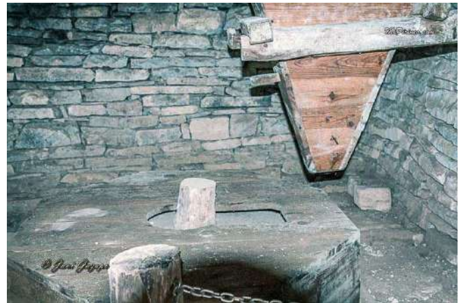
Molino rehabilitado de Ainielle