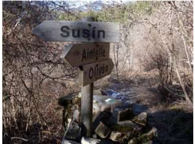
Cruce de caminos en Bergusa