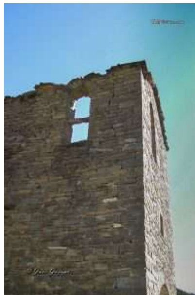
Altar y torre de la Iglesia de Ainielle